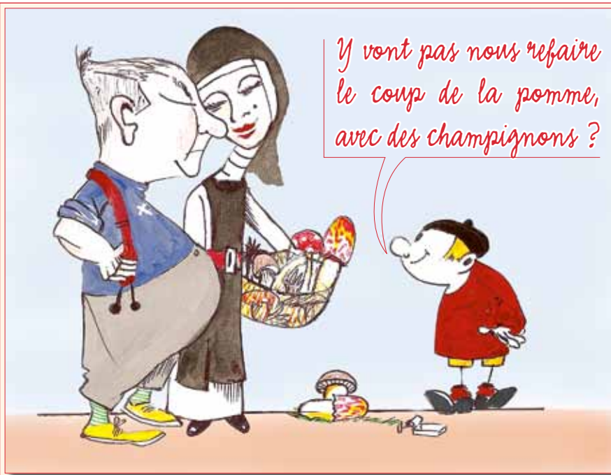
Dessin : Noah Triguely