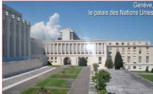
Genève, le palais des Nations Unies