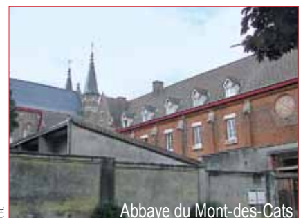
Abbaye du Mont-des-Cats